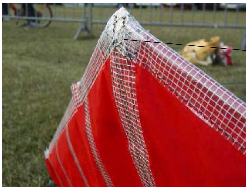
Renfort au niveau du nez

Finir par coudre les bords d'attaque (bande de mylar de 6 cm plié en deux)